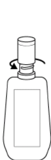
逆时针拧下塑料瓶口