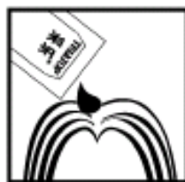
2. 将5ml采乐, 涂于发根及头发上