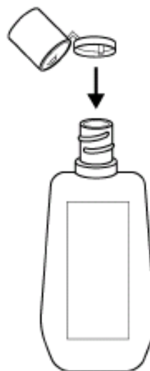
用内侧的突起按住薄膜, 用力压出一孔, 即可使用。