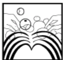
3. 按摩头皮3~5分钟, 至产生泡沫